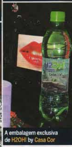
A embalagem exclusiva de H2OH! by Casa Cor