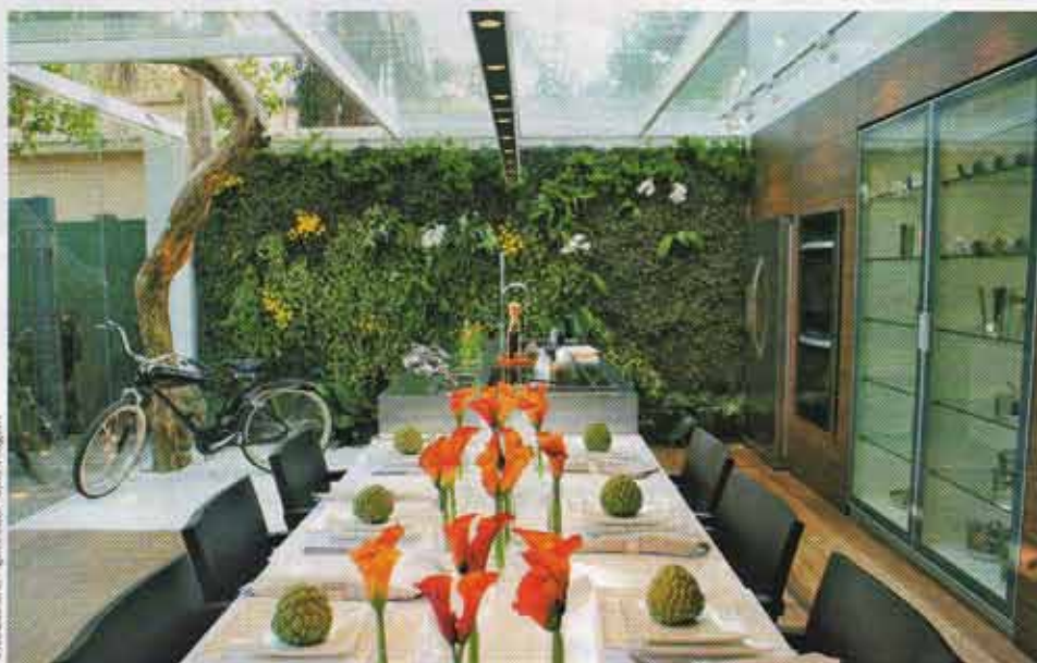
No loft de 330 m 2 , de Fernanda Marques, o teto de vidro na dupla cozinha/sala de jantar respeita a sinuosidade do tronco da árvore

As samambaias, que haviam caído em desgraça na decoração porque eram consideradas bregas, estão de volta. Esse tipo de planta pode ser incluída em jardins ou subir, literalmente, pelas paredes – como se fossem cortinas. Pacovás e palmeiras também ganharam passe livre no paisagismo.